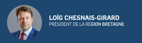
LOÏC CHESNAIS-GIRARD PRÉSIDENT DE LA RÉGION BRETAGNE

Cette année, la Région Bretagne organise pour la première fois la Parade maritime, trait d'union tous les quatre ans entre les fêtes maritimes de Brest et de Douarnenez ! À travers un parcours repensé pour cette huitième édition, encore plus respectueux de l'environnement, nous allons pouvoir contempler ensemble la richesse de cet écrin de nature préservée, sa biodiversité exceptionnelle et admirer la majesté des manœuvres des centaines de navires venus de nos côtes bretonnes et d'ailleurs. Je tiens à saluer le rôle primordial de tous les participants à l'organisation et particulièrement les bénévoles. Merci de votre engagement à la réussite de cette journée.